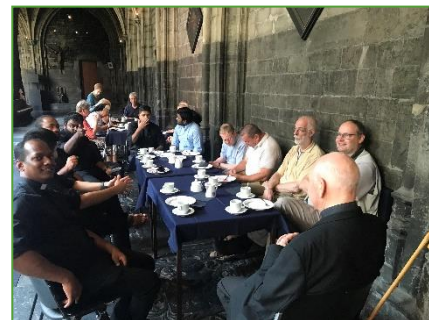
Einde van het werkjaar werd afgesloten in de OLVrouwekerk met een gezellig samenzijn.