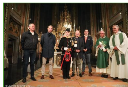
Harde werkers in de Sint Matthiaskerk.